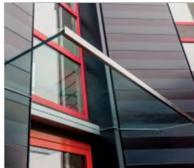
Wandklemmprofil eingepasst in einem Hauseingang