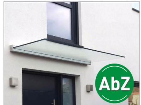
Wandklemmprofil in eckig und oval mit Allgemeiner bauaufsichtlicher Zulassung (AbZ)