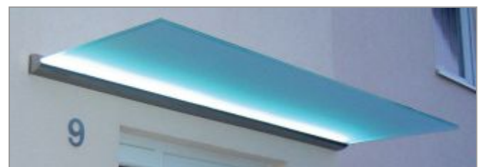
Vordach mit LED-Lichtband